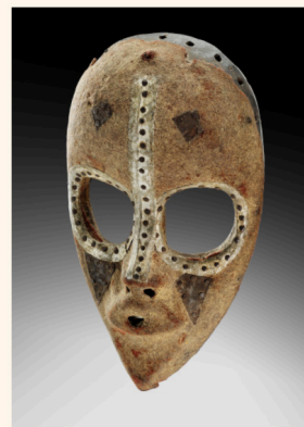
Masque 'Yoruba' Dan

JOHAN-FRÉDÉRIK HEL GUEDJ | 09 septembre 2020 16:49